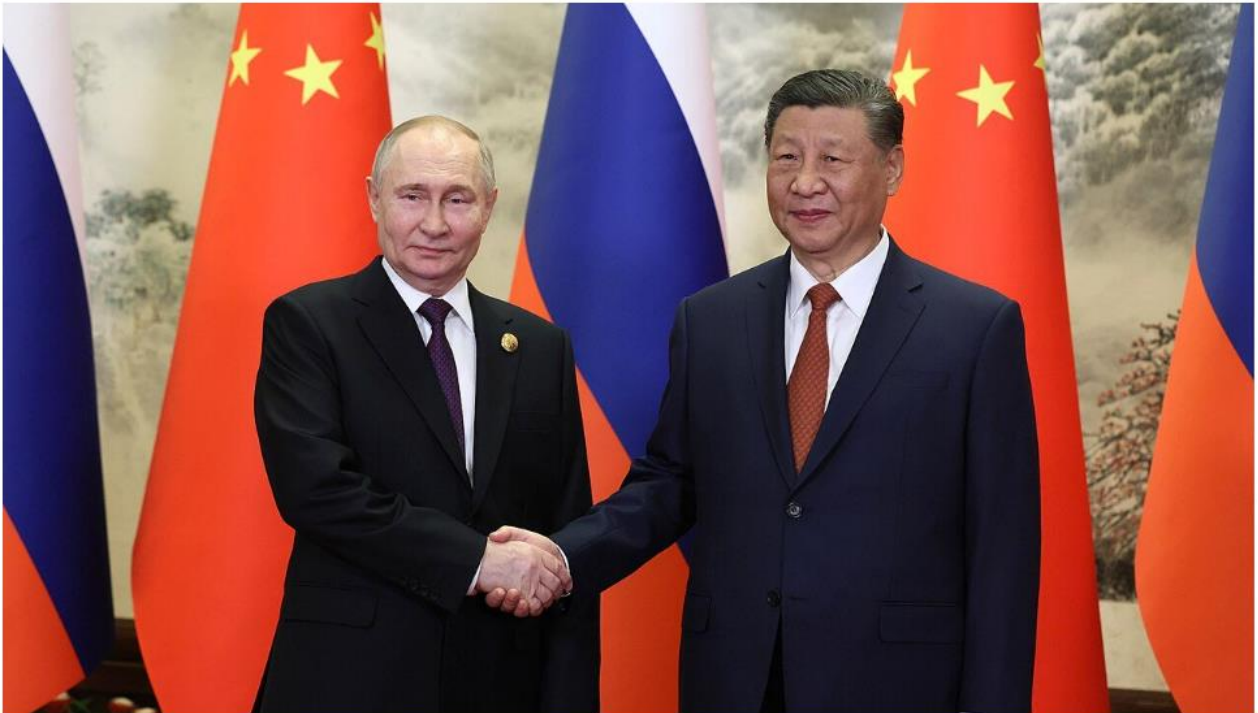
Ontmoeting tussen Poetin en Xi in mei 2024.

Opinie - José Ernesto Novaez Guerrero, Bel-REDH and DeWereldMorgen vertaaldesk